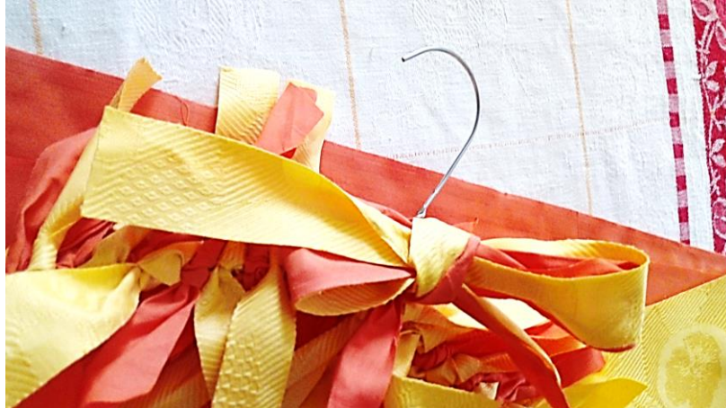
4. Ajouter un flot à la base du crochet.