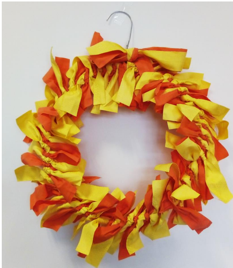
5. Et voici une superbe couronne récup' !